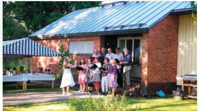
Pöytyän kirkkokuoro seurakuntatoimiston edustalla juhannusaatonäytelmänä.