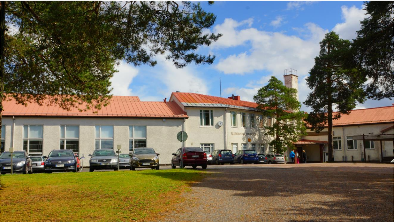
Elisenvaaran koulu ja lukio