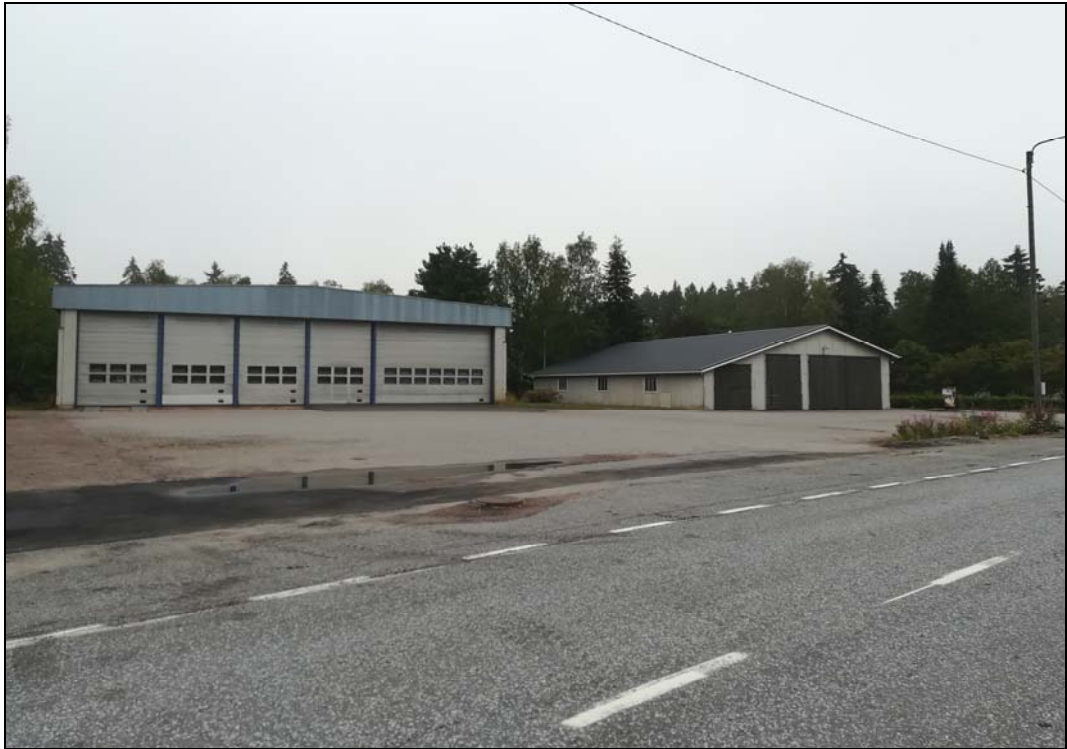
Kuljetusliikkeen hallirakennukset, etualalla Huitinperäntietä

Aloitteen asemakaavan muuttamisesta teki Kuljetusliike Olli Laine Ky, joka on yksi alueen maanomistajista. Asemakaavahankkeen tavoitteena on tarkistaa asemakaavassa esitettyä käyttötarkoitusta muuttuneiden käyttötarpeiden pohjalta. Voimassa olevan asemakaavan merkintä moottoriajoneuvojen huoltoasemien korttelialue (AM) on sisällöltään varsin rajoittava ja vanhentunut. Aluetta on hyödynnetty kuljetusliikkeen ajoneuvojen huolto- ja pysäköintitilana, mutta yrityksellä ei ole ollut aktiivista toimintaa enää viime vuosina.