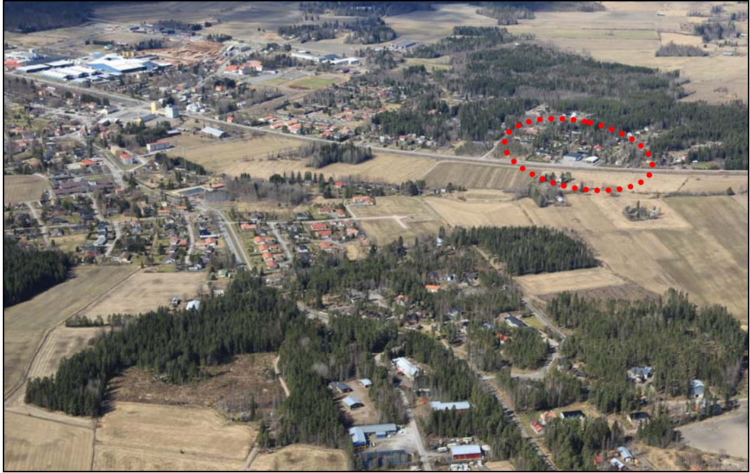
Ilmakuva Kyrön taajamaan idän suunnasta (suunnittelualue rajattu pistekatkoviivalla)