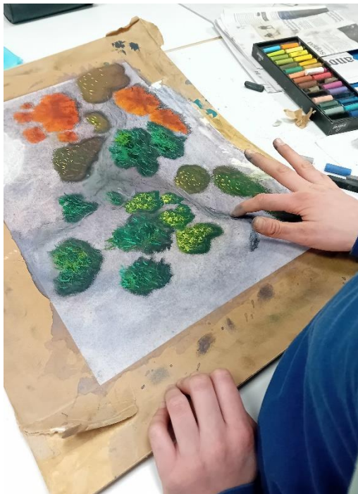
Kuvataiteen perusopetuksessa lapset ja nuoret voivat tutustua monipuolisesti taiteen eri tekniikoihin. Maalausvälineenä voidaan käyttää vaikkapa sormea.

12-18-vuotiaiden työpajassa etsitään jo omaa persoonallista työskentelytapaa ja harjoittelaan itsenäisempää tekemistä. Nuoret keskittyvät opettajan opastamina heitä henkilökohtaisesti kiinnostaviin kuvataiteen muotoihin ja perehtyvät valitsemiinsa taiteenaloihin ja tekniikoihin. Opintojen aikana harjoitellaan teknisten taitojen lisäksi pitkäjänteisyyttä, harrastuneisuutta sekä kykyä itsenäiseen työskentelyyn. Opetusryhmän koko on aina alle 12 opiskelijaa. Taiteen perusopetuksen kurssi. Materiaalit kuuluvat hintaan. (Katso tarkempi kurssikuvaus netistä.)