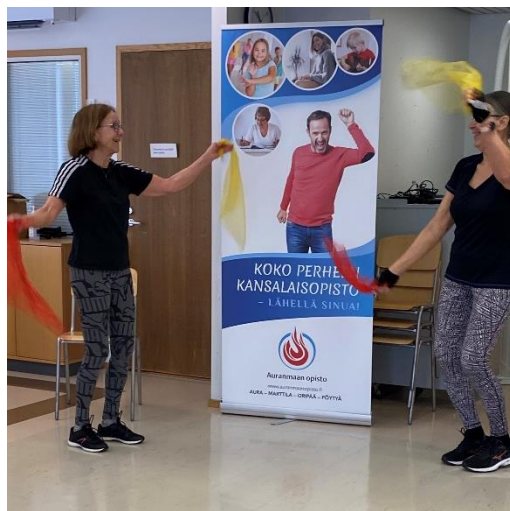
Liikkumisen riemua.

Tanssinopettaja (AMK) Maiju Virkkunen, 21 € Vahvistamme kehoa pilateksen perusliikemateriaalin avulla sekä teemme liikkuvuutta lisääviä harjoitteita hengityksen rytmittämänä. Harjoitukset tehdään rauhallisesti pääasiassa seisten ja jumppamaton päällä. Apuvälineinä voidaan käyttää pilatespalloja tai -rullia. Ota oma jumppamatto mukaan!