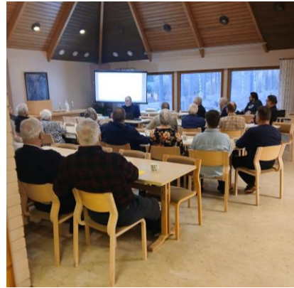
Auranmaan opisto järjestää suosittuja, korkeatasoisia yleisöluentoja yhteistyökumppaneineen mm. Oripäässä ja Marttilassa.

Luentosarjan järjestää Auranmaan opisto. Luentoihin on vapaa pääsy. Ei ennakoilmoittautumista!