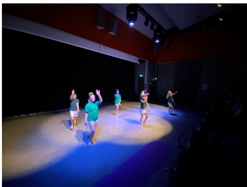
Tanssinäytös käynnissä.