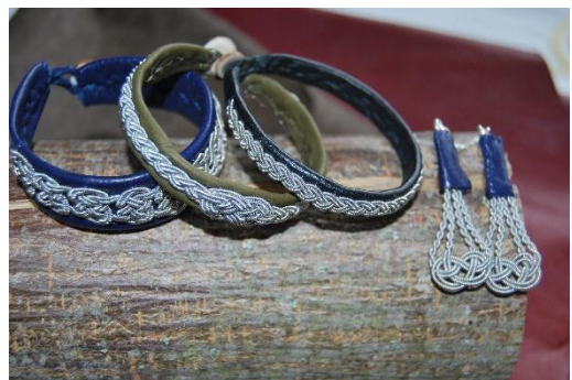
Tinalankapunonta on perinteinen saamelainen käsityötekniikka

Kahden kurssipäivän aikana tutkitaan ja tehdään lankojen kylmävärjäystä. Tekniikan opituasi voit helposti jatkaa innostavaa kokeilua kotona. Materiaalina käytämme alpakkaa, lampaanvillaa tai villasekoitelankoja, joiden pohjaväri voi olla luonnonvalkoinen, valkoinen tai vaaleanharmaa. Tarkempi kurssikuvaus tarvittavine välineistöineen ja materiaaleineen löytyy netistä. Materiaaleja voi ostaa myös opettajalta. Kokoontumiskerrat 27 ja 27.9 sekä 8.11.