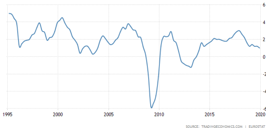
Kuvaaja 1: Euroalueen BKT:n kasvu on jatkunut maltillisena Euroalueen BKT:n muutos, prosenttia vuodessa, 1995-2020

Globaali talouskasvu on perustunut jo pitkään hyvin elvyttävään rahapolitiikkaan – korot on pidetty pohjatasoilla – euroalueella nollassa (ohjauskorko) ja Yhdysvalloissa nyt 1,0 – 1,25 %. Rahan määrän kasvu on ollut voimakasta. Tämä on näkynyt mm. Euroopan keskuspankin taseessa, joka on miltei viisinkertaisunut 1,0 triljoonasta 4,68 triljoonaan vuoden 2008 finanssikriisin jälkeen! Huomioitavaa on lisäksi erityisesti se, miten nopeasti korko-odotukset muuttuivat loppuvuoden 2018 tilanteesta. EKP linjasi joulukuun 2018 kokouksessa, että koronnostot voivat alkaa vuoden 2019 jälkimmäisellä puoliskolla taloustilanne huomioiden. Maaliskuun 2019 kokouksessaan EKP oli kyyhkymäinen ja alensi sekä talouskasvu- että inflaatioennustettaan, sekä antoi uuden linjauksen mahdolliselle korkojen nostolle alkuvuonna 2020.