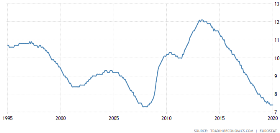
Kuvaaja 3: Euroalueen työttömyys on pysynyt laskutrendissä Euroalueen työttömyysprosentti, 1995-2020

USA:ssa Yhdysvaltain keskuspankki FED on jatkanut kesällä 2019 aloittamaansa korkoja laskevaa politiikkaa. Se laski ohjauskorkoaan ensin heinäkuussa, sen jälkeen syyskuussa ja lokakuussa 2019 ja nyt viimeisimpänä maaliskuussa 2020 puolella prosenttiyksiköllä 1,00-1,25-haarukkaan. Keskuspankki on perustellut päätöksensä globaaliin talouskasvuun liittyvillä epävarmuustekijöillä. Markkinoilta odotetaan lisää koronlaskuja koronavirusepidemian leviämisestä johtuen.