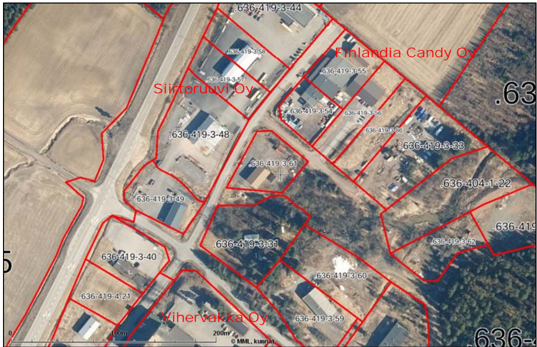
Ilmakuva suunnittelualueelta

Asemakaavahankkeen tavoitteena on lisätä teollisuusalueen yritysten toimintamahdollisuuksia ja ajantasaistaa nykyisiä kaavamerkintöjä. Korttelialueiden laajuutta tarkistetaan Lallintien ja Kantatien 41 risteysalueen läheisyydessä. Korttelin 1 tontilla 1 sijaitsevassa teollisuushallissa toimiva makeistehdas Finlandia Candy Oy tarvitsee laajennukselleen tilaa Pajatien puolelle enemmän, mitä voimassa oleva asemakaava mahdollistaa. Korttelin 4 asuinliikerakennuksen tontin 1 eteläosasta on kiinnostunut viereisessä korttelissa toimiva Vihervakka Oy, jolla on tarpeita laajemmille toimintatiloille. Molemmat yritykset ovat sitoutuneet korvaamaan vaadittavien asemakaavan muutosten kustannuksia.